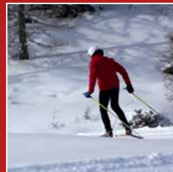
SCI NORDICO SKI NORDIQUE