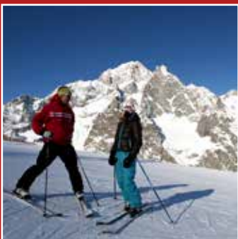
SCI DISCESA SKI DE DESCENTE