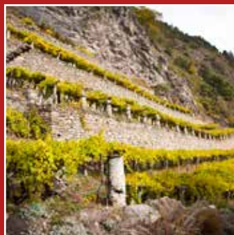
DEGUSTAZIONI VINI DÉGUSTATIONS DE VINS