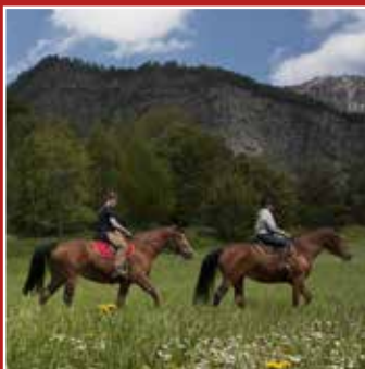
PASSEGGIATE A CAVALLO EQUITATION