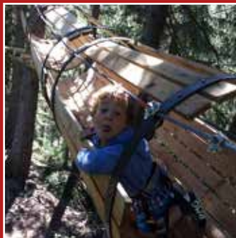
PARCO AVVENTURA PARC AVENTURE