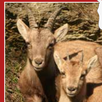
PARCO ANIMALI INTROD PARC ANIMALIER D'INTROD