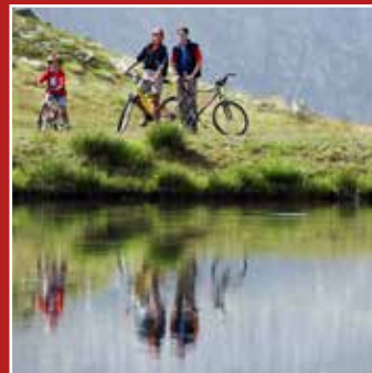
MOUNTAIN BIKE VTT