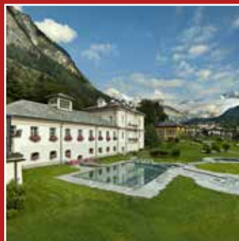
TERME DI PRÉ THERMES DE PRÉ-SAINT-DIDIER