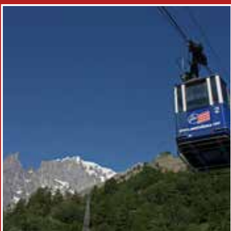
FUNIVIE MONTE BIANCO TÉLÉPHÉRIQUE DU MONT-BLANC