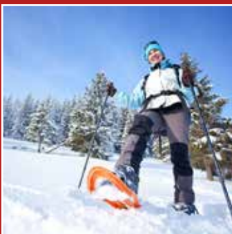
CIASPOLE RAQUETTES DE NEIGE